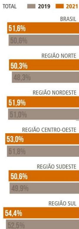
Tabela 1. Aumento da proporção de trabalhadoras domésticas chefes de família.

Outro desafio que impede que mais mulheres exerçam funções de liderança fora do ambiente doméstico é análogo às duplas e triplas jornadas que encaramos em nossos lares. Durante a pandemia, com o fomento do trabalho remoto (em algumas categorias de emprego), muitas mulheres, que já acumulavam funções, viram-se mais sobrecarregadas. Isso porque não havia mais a distinção entre os ambientes doméstico e o do trabalho: ambos se tornaram algo único. Mulheres se dividiam entre o cuidado com os filhos e as incumbências de seus empregos. Em julho de 2020, “[A] executiva Dris Wallace contou, em publicação no Instagram, que foi demitida por não conseguir manter os filhos em silêncio durante ligações de negócio.” (LOIOLA, 2020). Este seria apenas um indicativo de contrariedades de uma sociedade eminentemente machista.